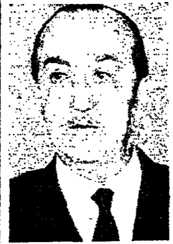
مؤتمرا قمة اسلاميا